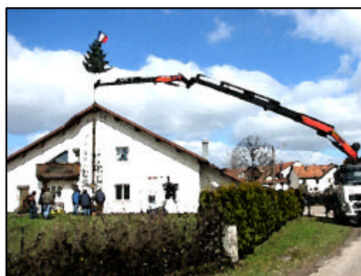
Samedi 29 mars 2008 : jour de sapins